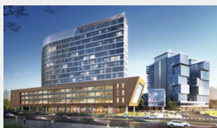
광명 의료 복합클러스터