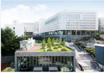
국내 대학 중 단일면적 최대 규모 75,058㎡ / 1,185억 원

중앙대학교는 파격적인 투자와 추진력으로 혁신적인 시설 인프라를 갖추고 있다. 두산그룹의 대대적인 재정지원 아래, 대규모 인프라 확충과 지속적인 교육환경 개선을 이어가고 있는 중앙대학교는 앞선 인프라로 혁신에 혁신을 더하며 끊임없이 성장하고 있다.