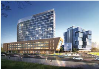
광명 의료 복합클러스터 82,600㎡ / 700병상